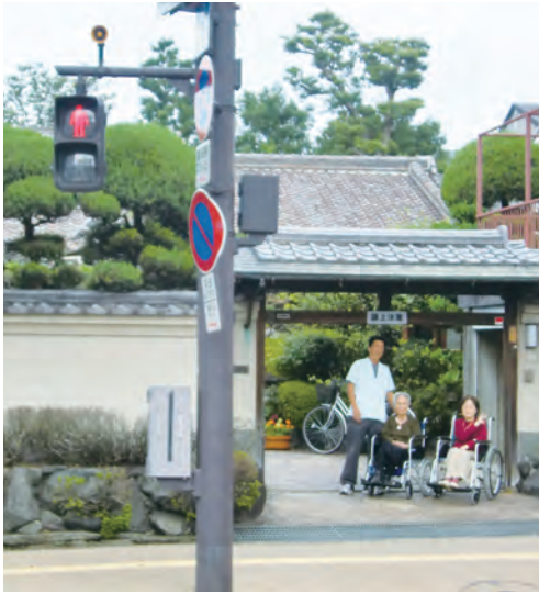
デイガーデン八重桜の玄関前 (写真は10月22日撮影)