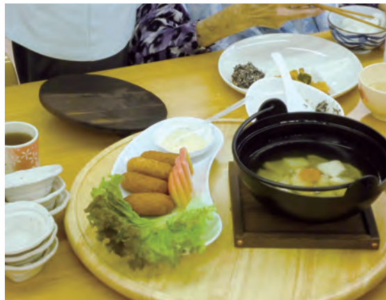
小型の廻るテーブルで八品を提供