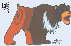
カット：栗原 もとのり

真実はと問えば、金太郎は猛獣の熊(くま)ではなく、間違いなく「子馬」を利用したと考えられるのです。古代の日本では「小さい子ども馬」のことを「句馬・くま」と呼称していたということなのです。この句と馬という文字が合体して「駒」という文字が生まれた。駒を漢和辞典で見ると、「馬と音符の句(小さい意)とからなり、子馬の意を表わす。若くさかな二歳馬のこと」であり、「子馬のこと」である、と注釈する。中国では馬を(マ)と発音します。「句・ク」が小さいという意であり、小さい馬を「句馬=駒」と表記したということです。クマと読めた「駒」はまさに子馬のことだったと考えたほうがわかりやすい。