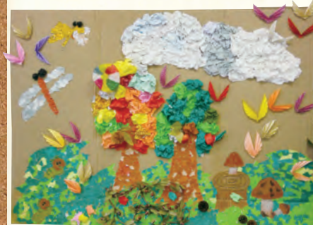
神無月工作日の合作品

デイガーデンでは10月26日に利用者様と一緒にお花の苗を植えました。 プランターには利用者様の顔写真入りの名札を付けました。 これから皆さんと一緒にお花を大切に育てていきたいと思ひます。