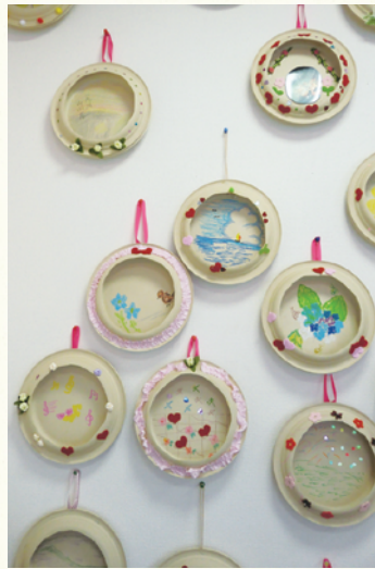
デイサービス八重桜 月例工作作品

庭のトマトが真っ赤になり収穫しました。皆さんと一緒に食べたトマトの味は格別でした。これからの成長も楽しみです。8月2日でデイガーデンがオープンして1周年です。これからもよろしくお願致します！