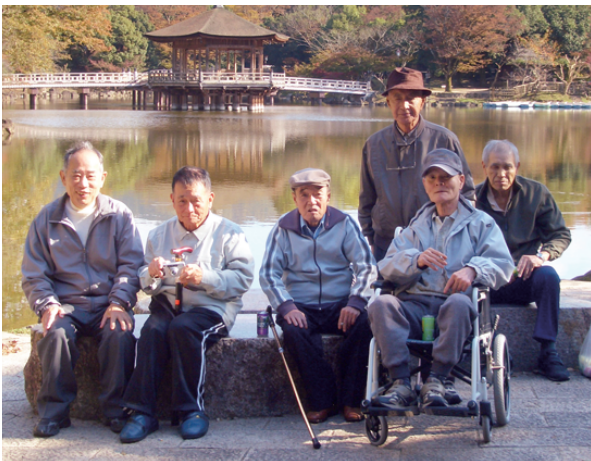
休憩地の浮見堂を背景に!

十二、十六、二十日と、安全のため三組に分かれてのドライブでした。今年はずっと温かい気候のせいも、例年より紅葉が遅かったようですが、大仏池などでは際立つ紅葉(写真)が、かえって美しく印象的でした。大仏池↓志賀直哉旧邸宅↓奈良公園↓浮見堂↓帰苑