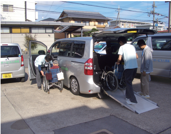
六台の車で、出発準備—安全第一に—!