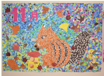
デイハウス八重桜 月例工作作品

陽の暮れがめっきり早くなりました。朝夕の冷え込みも増してきました。奈良市内では、インフルエンザやノロウイルスが流行しはじめています。「帰宅後のうがい・手洗い」をかかさず、体を冷やさないようにしてください。また、入浴で体を温めることは必要ですが、「ちょっと熱っぽい、食欲がない」場合は、かかりつけ医に相談してみてください。もちろん、ケアマネージャーやデイなどでも相談していただければありがたいです。