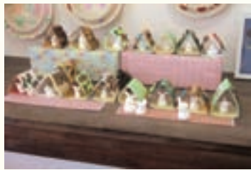
デイサービス八重桜 月例工作作品

私は毎日出勤し皆様と楽しく過ごし、笑顔を拝見することです。それとよく冷えたビールでしょうか。