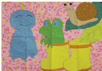
デイハウス八重桜 月例工作作品

今月は一大イベントの夏祭りもあります。夏バテせず是非ご参加下さい。職員も栄養ドリンクを飲んで頑張ります。ご期待下さい！