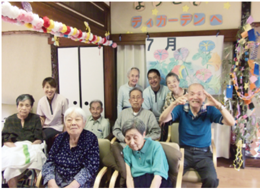
楽しい家族！？皆さまお元気ですよ！

丸い風船に和紙を切り張り、色彩豊かにまさに芸術作品です。 ベッドのかたわらに置くと、癒しの就寝空間になりますヨネ！