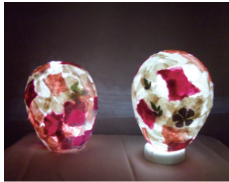
会心の出来！ 幻想的な和紙の照明器具です。