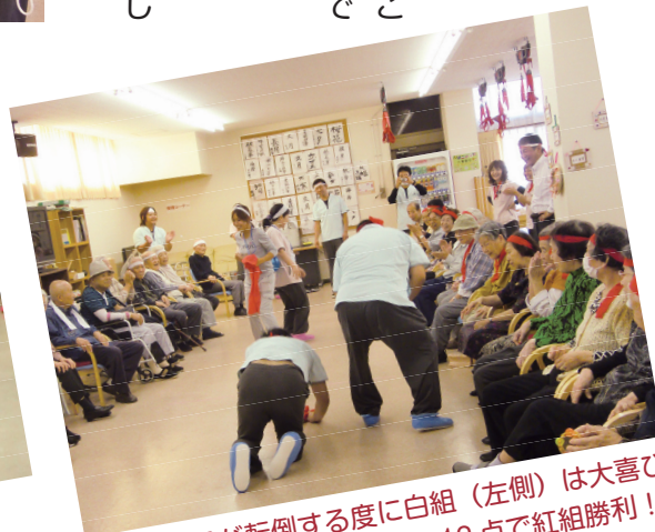
紅組の職員が転倒する度に白組(左側)は大喜びだけど、結果は白組9点紅組12点で紅組勝利!