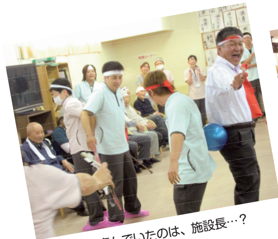
一番喜んでしたのは、施設長...?