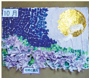
デイガーデン八重桜 月例工作作品

地域の秋祭りも終わり、新聞紙面で紅葉の見頃の記事を見かけるようになりました。今年もドライブを企画しております。体調を崩さず皆さん参加して下さい。さて、皆様のご自宅ではもうお鍋をされましたか？スーパーでは今年も色んな変わったお鍋の出汁が売っていますよね。11月からはお鍋の屋敷も予定しておりますのでお腹いっぱい召し上がってください。