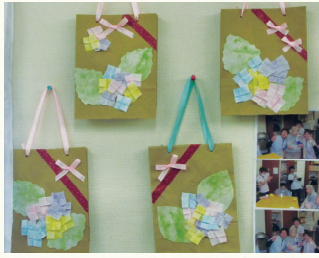
デイハウス八重桜 月例工作1作品

宝来事業所がオープンして早や、1ヶ月が過ぎました。慣れない事ばかりで私も職員も業務に追われる毎日だったような気がします。しかし、デイサービスである以上サービス重視に気持ちを切り替えて職員一同頑張っております。ぜひ一度見学・体験にお越しください。