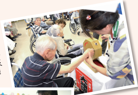
一等賞おめでとう です。