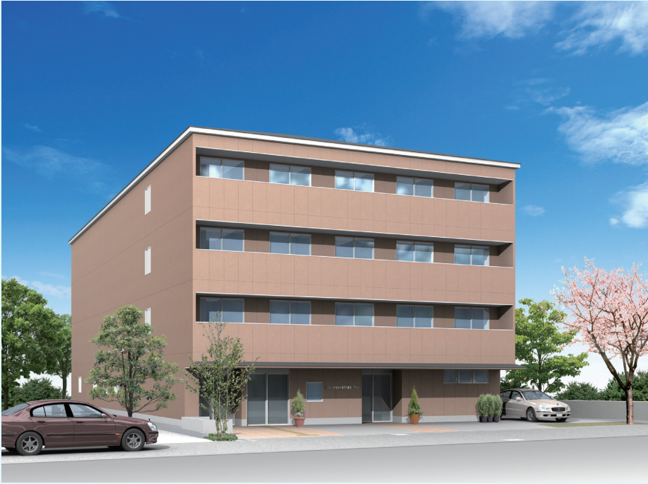
ファミリーモア八重桜 門真館 (全 36 戸)

ファミリーモア八重桜は、高齢者の住まいにデイサービスが付いた新しいアーバンリゾートとなります。二十四時間入居者様の安全と安心の生活スタイルが可能になります。左は2棟目の完成予想図です。