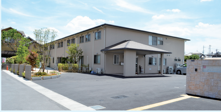
ファミリーモア八重桜 宝来館

サービス付き高齢者向け住宅！ ファミリーモア八重桜宝来館、そして門真館、 最近朱雀館が稼働しました。おかげ様で3館と も満室になりました。次施設も乞うご期待！