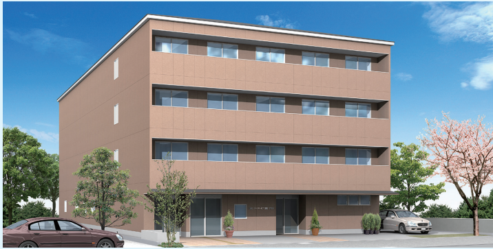
ファミリーモア八重桜 門真館