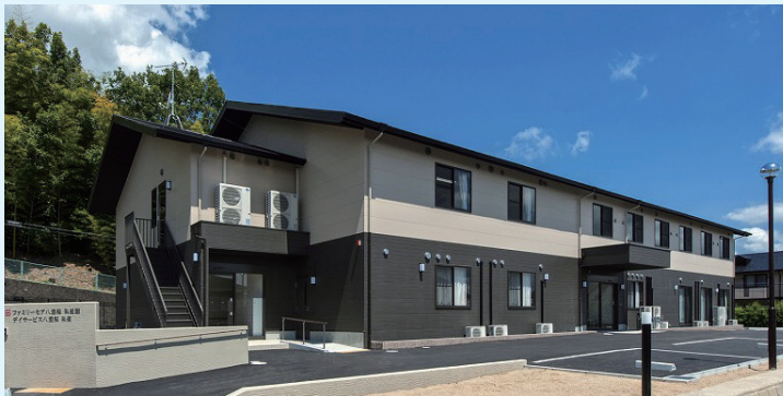
ファミリーモア八重桜 朱雀館