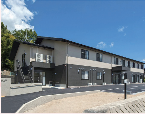
サービス付き高齢者向け住宅 ファミリーモア八重桜 朱雀館