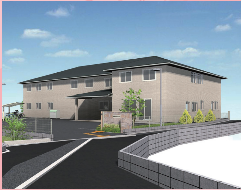
住宅型有料老人ホーム ファミリーモア八重桜 押熊館