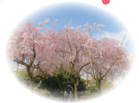
大仏鉄道記念公園の枝垂桜

今年も恒例のお花見ドライブに出かけました。雨続きの春でしたが、晴れ間を見つけてのドライブ、満開の桜の花に負けない皆様の笑顔が素敵でした。