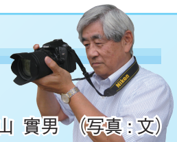
中山 實男 (写真:文)