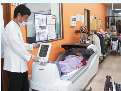
ベッド型マッサージ器「アクアタイザー」

写真のようにコントロールパネルで水温や部位ごとのマッサージの強さ、治療時間の設定などができ、利用者様ひとりひとりが最適な状態で利用していただけます。また、頭部には覆いが付いていますが、この中には音楽が流れていて、周囲の環境から遮蔽されたりラックスできる空間を作り出しています。導入以来、毎日十人ほどの方たちが利用されて好評です。