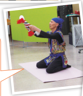
銭太鼓 & マジックショー