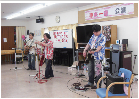
夢楽らいぶ一座のみなさん

自ら「高齢者の心も体も元気にするショーテクニック」にこだわっているとおっしゃるとおり、パワフルなステージにぐいぐいと引きつけて、最後は笑顔で終わりました。