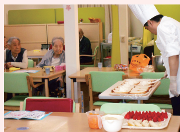
五月十四日 母の日 押熊喫茶手作りおやつ