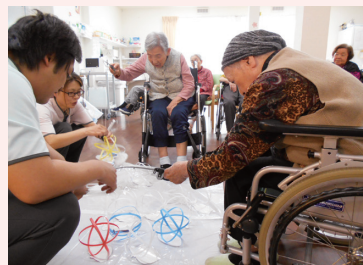
五月一日 釣りゲーム