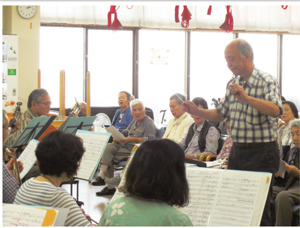
マンドリンクラブまほろばコンサート