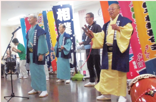
けはや相撲甚句会の皆様