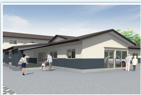
平城館完成予定パース図

業界では珍しい所得段階に応じた料金設定 八九,〇〇〇円～二九,〇〇〇円(家賃管理共益費、食費)