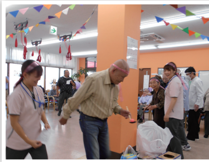
落とさぬように慎重に……