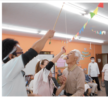
下がったパンは食べにくい

短い時間の中で利用者様と職員と一緒になって飛んだり跳ねたり走ったり…職員のだタバタには利用者様は大喜び！あつという間に時間も経ちました。負けた白組のキャプテンに罰ゲームを受けてもらうのが最後のハイライト。大爆笑のうちにフィナー