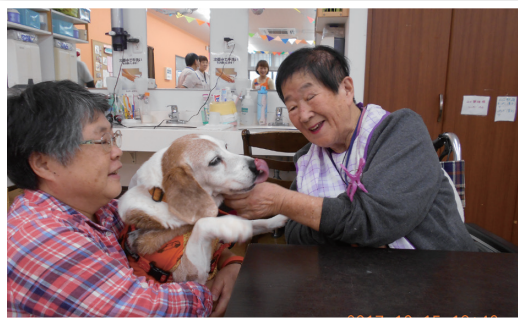
ワンちゃん大好き