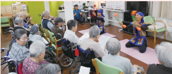
二人で息の合った銭太鼓