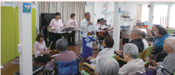
マロンフレンズの皆様の歌と演奏