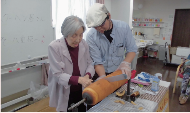
巨大なバームクーヘンをカットします