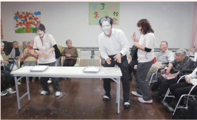
施設長の顔も真っ白に