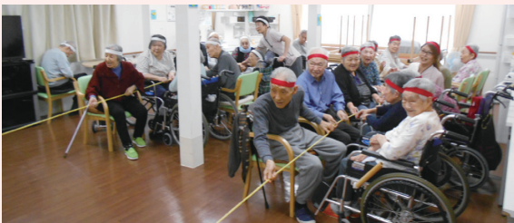
紅白に分かれて綱引き