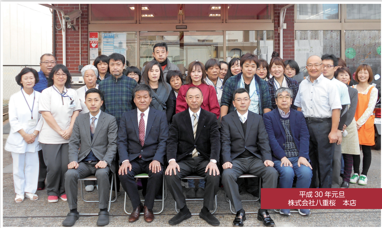
平成 30 年元旦 株式会社八重桜 本店