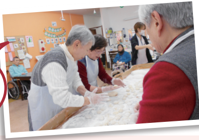
小餅は小さめに丸めていきます