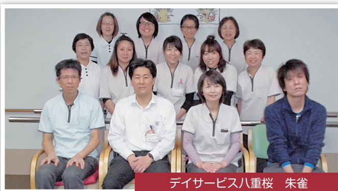
デイサービス八重桜 朱雀