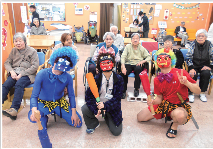
厄を祓った後は、鬼と一緒に記念撮影

叩いて被ってジャンケンポン！勝ったら鬼の金棒で相手を叩きまです、負けた方は洗面器を被って防御。鬼はたくさん利用者様から叩かれ退散していきました。