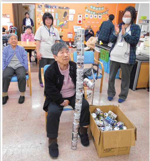
12個まで積み上がりました