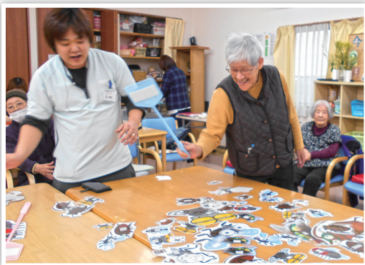
よく狙って…ピシッ！